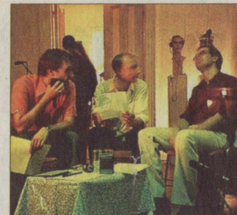
LIGNA / MAK

Bei „Mak on ear“ zeigen Künstler ab 21 Uhr im MAK (1., Stubenring 5) ihre Beziehung zum Medium Funk-Kopfhörer. 7,90 €, Studenten 4 €. ☎ 711 36-0.